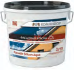
FACADE SILICON AQUA Модифицированная силиконом фасадная акриловая краска