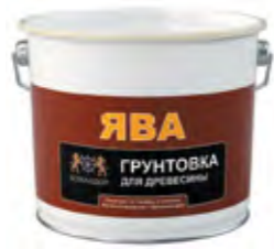
ЯВА Грунтовочный антисептик