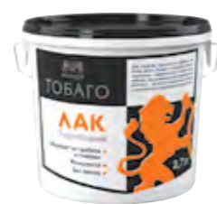
ТОБАГО Полиакриловый лак для внутренних работ