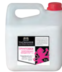
ТАСМАНИЯ ИНТЕРЬЕРНАЯ Укрепляющая акриловая грунтовка для интерьеров