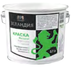
ЗЕЛАНДИЯ Щелочестойкая фасадная акриловая краска