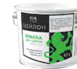
ЦЕЙЛОН Фасадная акриловая краска для цоколя