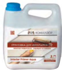
INTERIOR PRIMER AQUA Укрепляющая полиакриловая грунтовка для интерьеров