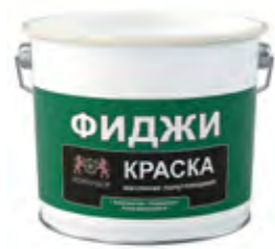
ФИДЖИ Полуглянцевая масляная краска