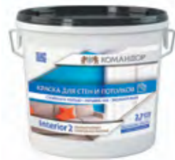
INTERIOR 2 Совершенно матовая полиакриловая краска для стен и потолков