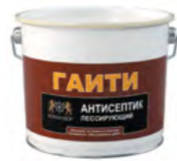
ГАИТИ Лессирующий антисептик