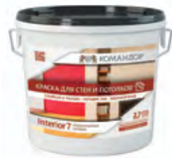
INTERIOR 7 Матовая полиакриловая краска для стен и потолков