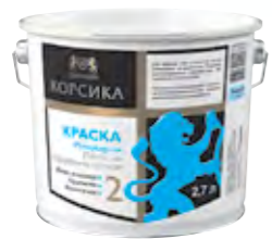
КОРСИКА Совершенно матовая полиакриловая краска для стен и потолков