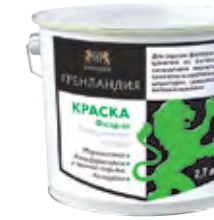
ГРЕНЛАНДИЯ Матовая фасадная полиакриловая краска