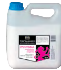
ТАСМАНИЯ УНИВЕРСАЛЬНАЯ Полиакриловая грунтовка для фасадов и интерьеров