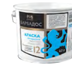
БАРБАДОС Полуматовая износостойкая полиакриловая краска для стен