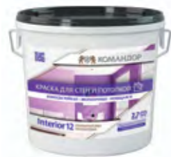
INTERIOR 12 Полуматовая полиакриловая краска для стен и потолков