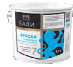
БАЛИ Матовая полиакриловая краска для стен и потолков