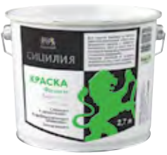
СИЦИЛИЯ Модифицированная силиконом фасадная акриловая краска