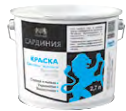
САРДИНИЯ Матовая полиакриловая краска