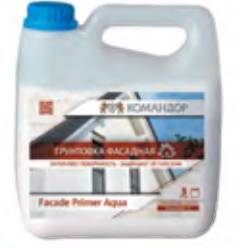
FACADE PRIMER AQUA Полиакриловая фасадная грунтовка