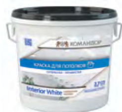
INTERIOR WHITE Совершенно матовая полиакриловая краска для потолков