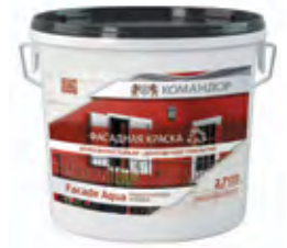
FACADE AQUA Щелочестойкая полиакриловая фасадная краска