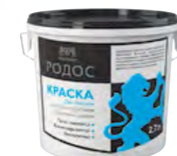
РОДОС Совершенно матовая полиакриловая краска для потолков