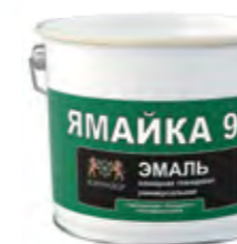
ЯМАЙКА 90 Высокоглянцевая алкидная эмаль для наружных и внутренних работ