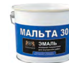
МАЛЬТА 30 Полуматовая алкидная эмаль для внутренних работ