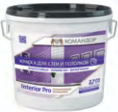
INTERIOR PRO Полуматовая моющаяся полиакриловая краска для стен и потолков