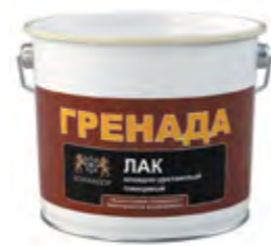
ГРЕНАДА Алкидно-уретановый лак для внутренних работ